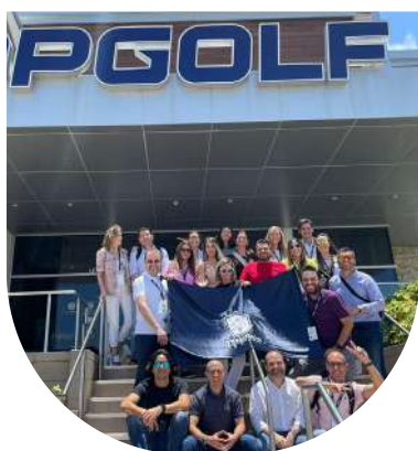
📍 TOP GOLF International Experience 2022