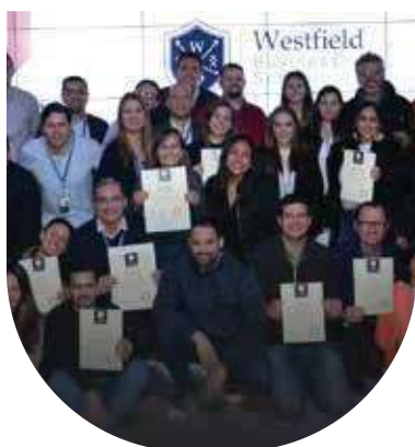
📍 The Valley: International Experience 2019