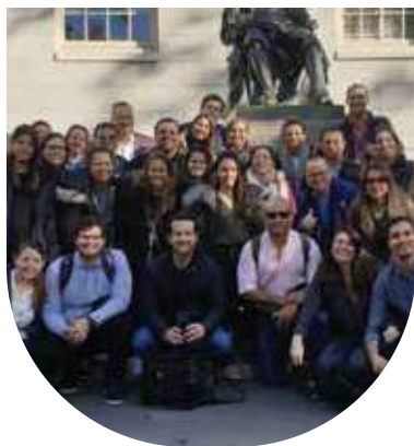
📍 Harvard: International Experience 2019